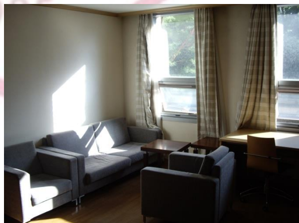
Gemeinschaftsraum (4er WG)