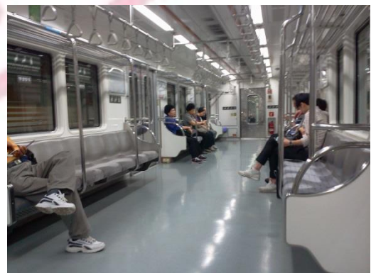
U-Bahn in Seoul

Falls doch, dauert es mit der U-Bahn nur 15 Minuten bis ins Stadtzentrum. Die U-Bahn ist das preiswerteste und eine sehr bequeme Art um in Südkorea von A nach B zu gelangen, da die Anschlüsse hervorragend sind und die Züge alle 3 bis 4 Minuten fahren. Eine Fahrt quer durch die Stadt kostet euch nur 80 Cent. Die U-Bahn ist ein eigener kleiner Mikrokosmos für sich, der unheimlich interessant ist. Es ist so sauber, dass man vom Boden Essen der U-Bahn essen könnte und es gibt zahlreiche Hinweisfilme, wie man sich in der U-Bahn verhalten soll. In der U-Bahn selbst ist es absolut still, da alle Koreaner nur mit Ihren Smartphones beschäftigt sind und niemand sich mit dem anderen unterhält.