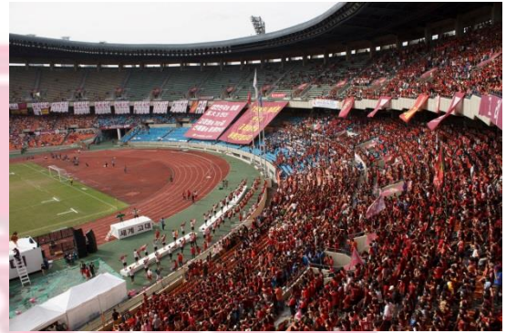
KoYon Games 2012

Ganz besonders beeindruckt haben mich dabei die „ KoYon Games “ eine Sporthighlight zwischen der Korea University und der Yongsei University, die zehntausende Zuschauer in die Stadien lockt. Eine einmalige ausgelassene und positive Atmosphäre, wie ich sie bei deutschen Sportveranstaltungen noch nie erlebt habe. Es wird gegessen, getrunken, gemeinsam gesungen und getanzt während die Sportteams der beiden Universitäten in sieben verschiedenen Sportarten gegeneinander antreten. Ein Muss für jeden Studenten der, mal in Südkorea gewesen ist!!!