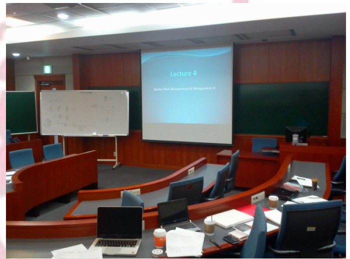
Vorlesungsräume der Korea University

Die Vorlesungen dauern teilweise 90 Minuten, teilweise 120 Minuten, wobei es nach der Hälfte der Zeit immer eine kurze Pause gibt. Im Gegensatz zu Göttingen werden die Vorlesungen in kleineren Gruppen gehalten. In der Regel zwischen 10 und 50 Personen. In einem Fall waren wir sogar nur 3 Studenten, so dass man eher das Gefühl hatte in einer Diskussionsrunde zu sein anstatt in einer Vorlesung. Insgesamt ist der Unterricht sowieso ist mehr auf den Austausch zwischen Professoren und Studenten ausgerichtet, so dass Fragen der Studenten von den Professoren gern gesehen sind und auch die Professoren aktiv das Gespräch mit den Studenten suchen. Häufig engagieren sich die Professoren auch außerhalb des Lehrplans und bieten an gemeinsam Ausflüge zu unternehmen oder essen zu gehen, was die Zusammengehörigkeit und das Gruppengefühl unheimlich fördert.