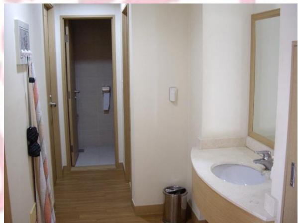
Badbereich des CJ House